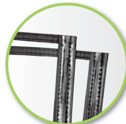
ジップロック留め仕様