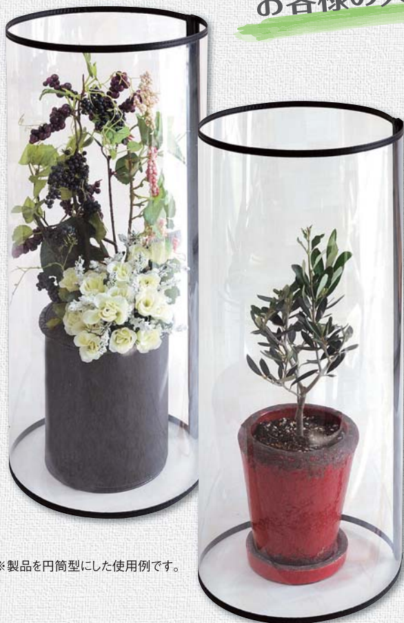
※製品を円筒型にした使用例です。

ホテル・斎場などで生花を使用することがございますが、花粉が衣装などに付着するおそれがあります。弊社はお客様の大切な衣装をお守りする「ABW花粉ガードホルダー」をご提案致します。