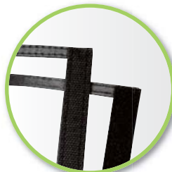
マジックテープ留め仕様

マジックテープ、ジップロック留めで素早く、簡単に円筒型にできます。生花の上からかぶせることで、花粉の付着を防ぐことができます。